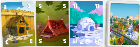
Приклад приготування до гри для 3 гравців

У свій хід ви можете виконати одну з двох дій: зробити ставку або спасувати .