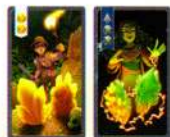
Получить 2 кристалла Улучшить 2 кристалла